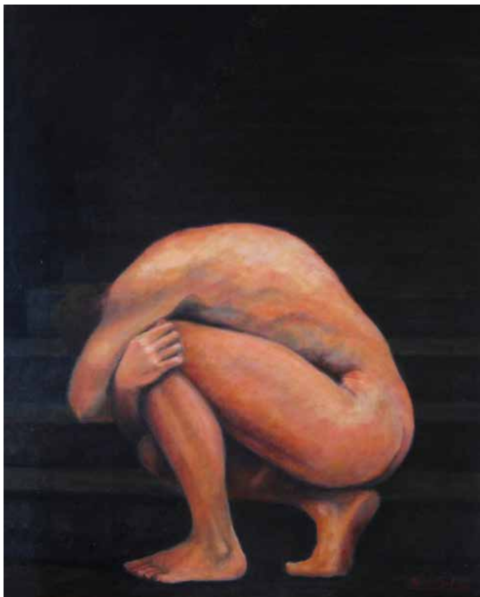
PODREM? (Oli sobre tela, 61 x 46 cm)