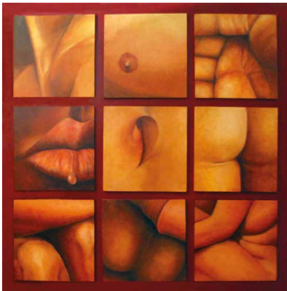
ANATOMIES (Oli sobre fusta, 150 x 150 cm)