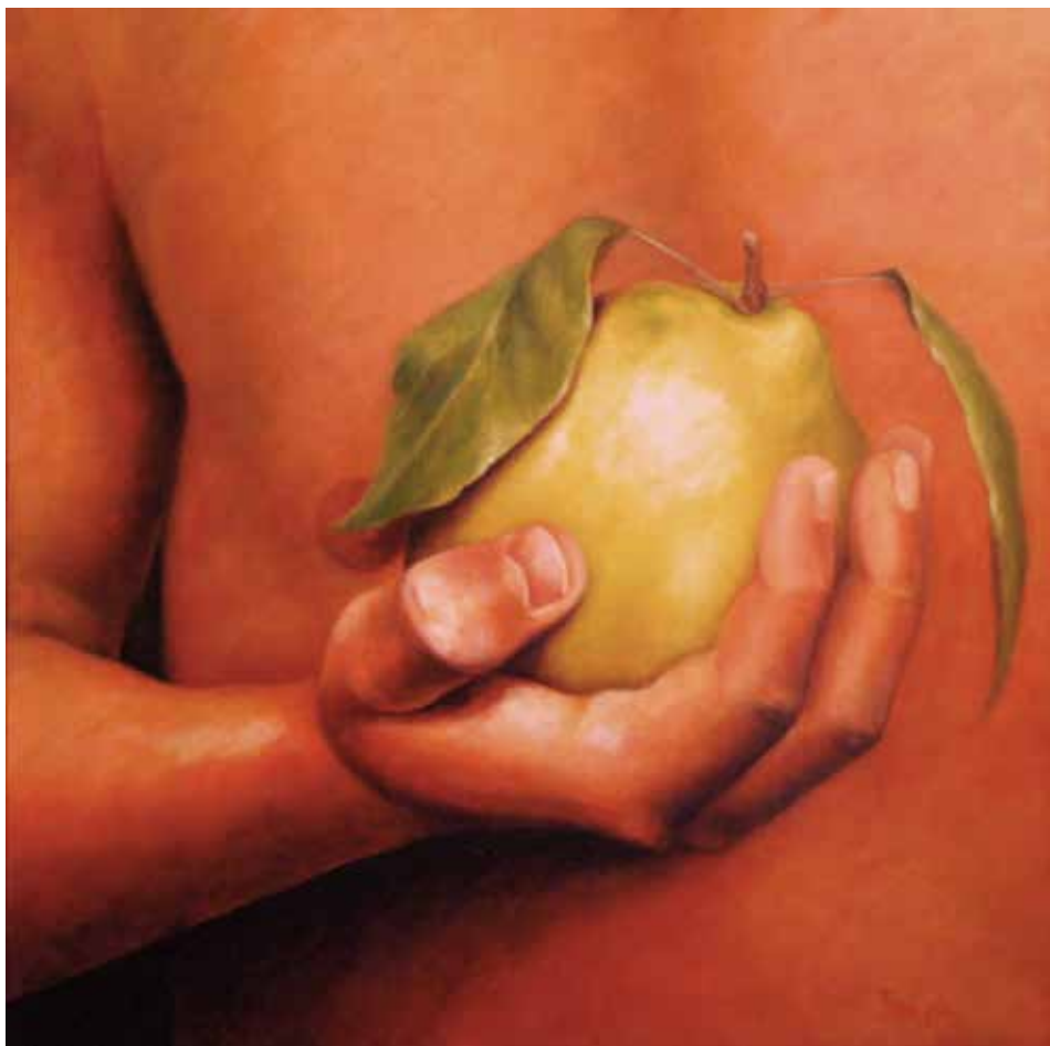
OFRENA: CODONY (Oli sobre tela, 60 x 60 cm)