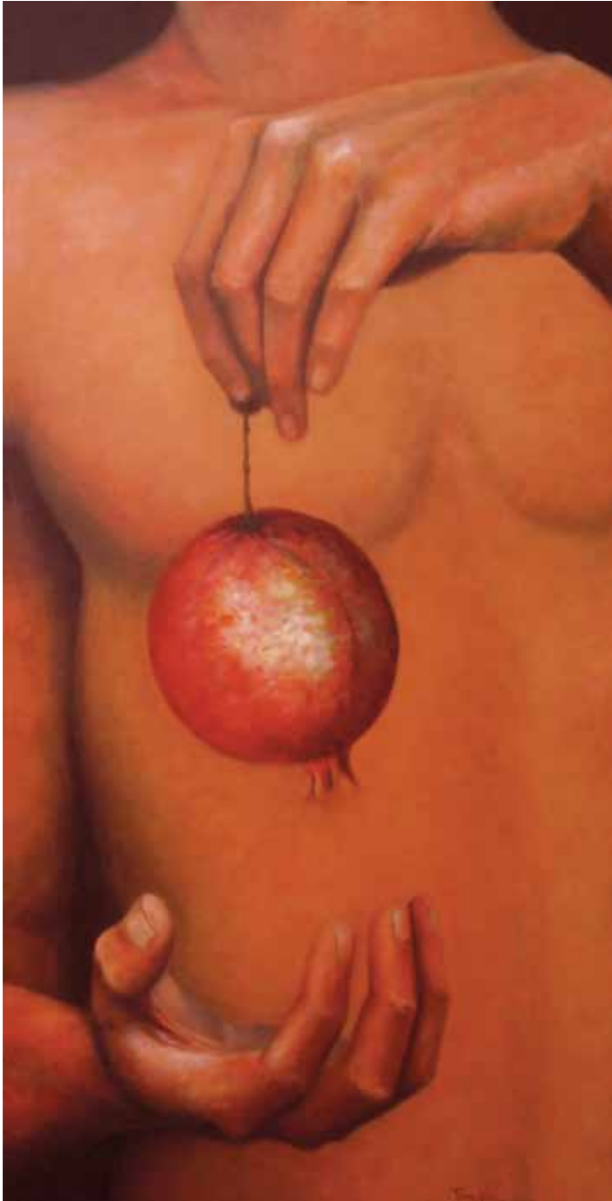
NEWTON (Oli sobre tela, 92 x 46 cm)