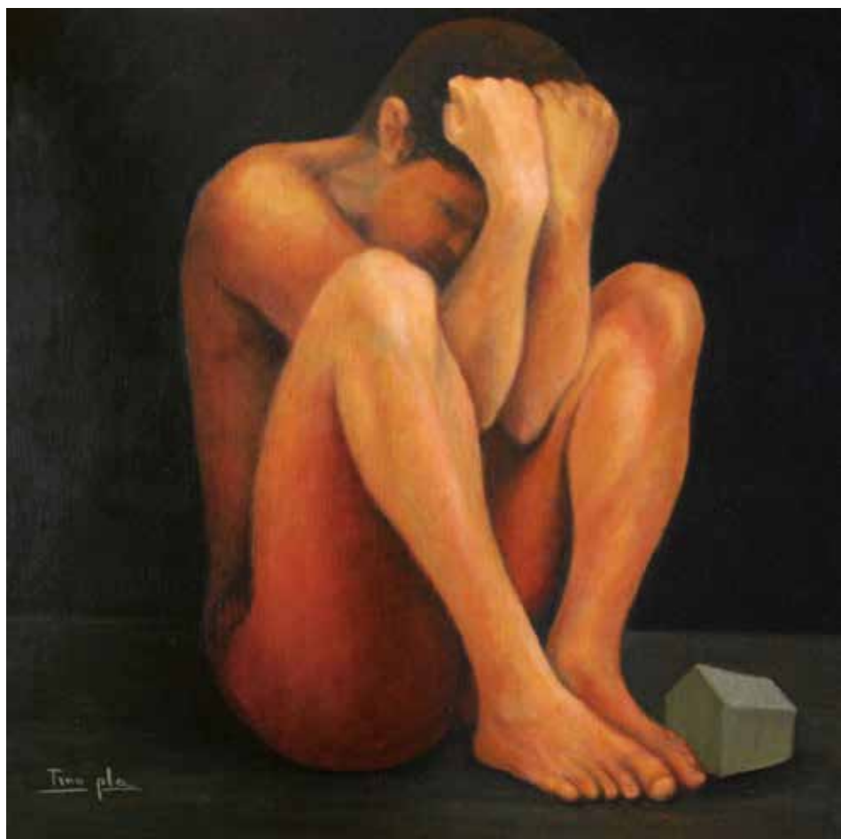
CLAM (Oli sobre taula, 30 x 60 cm)