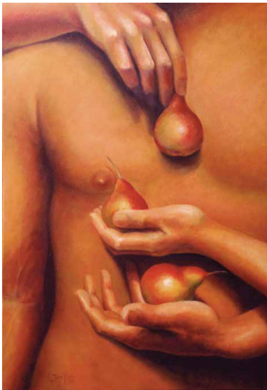
PERES (Oli sobre tela, 73 x 50 cm)