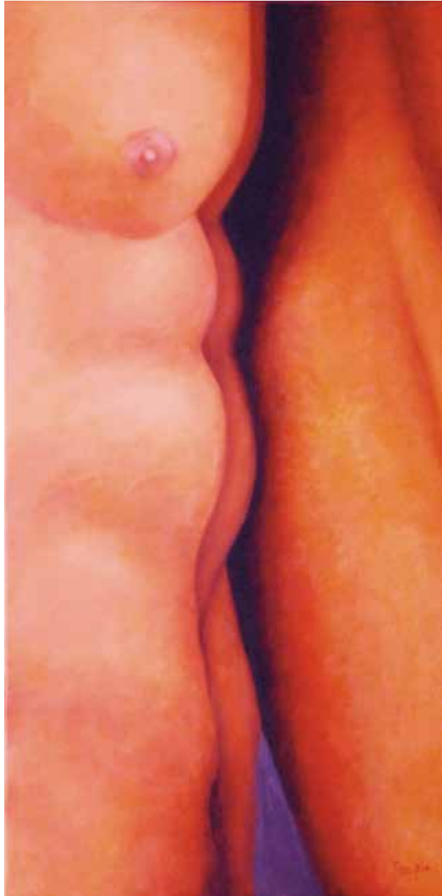
JOC (Oli sobre tela, 92 x 46 cm)