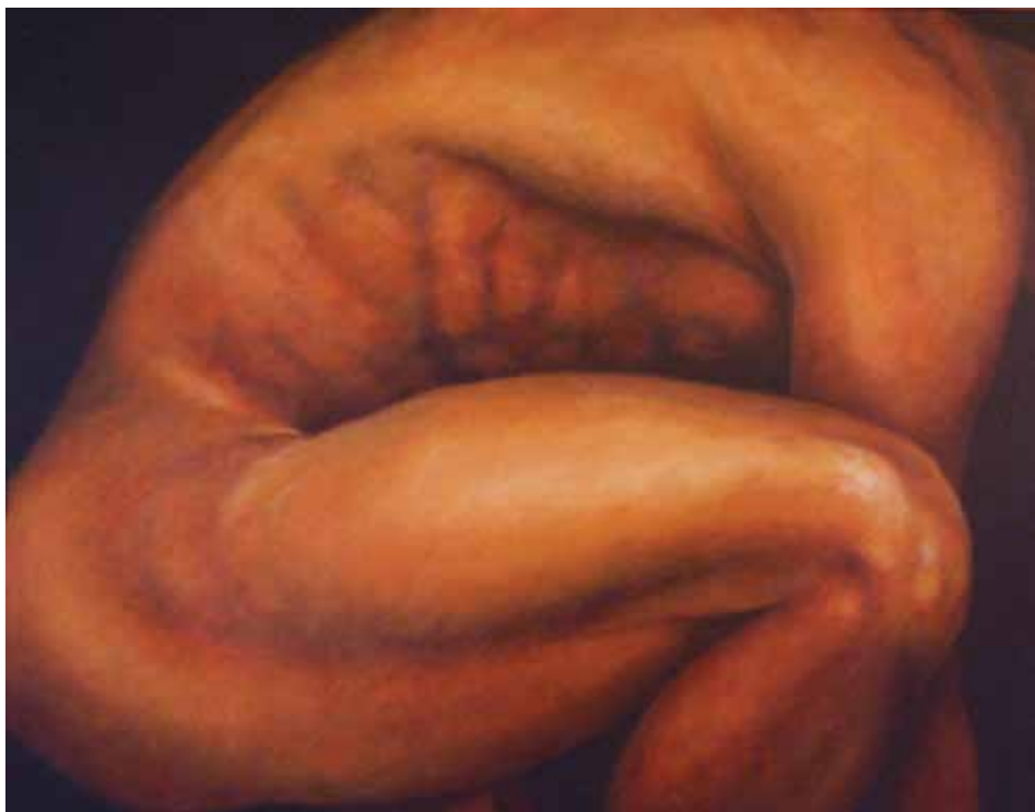
ATLETA (Oli sobre tela, 92 x 73 cm)