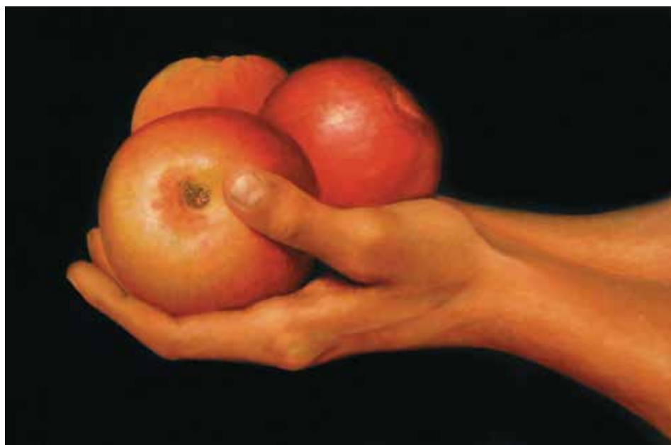
OFRENA: POMES (Oli sobre tela, 50 x 73 cm)