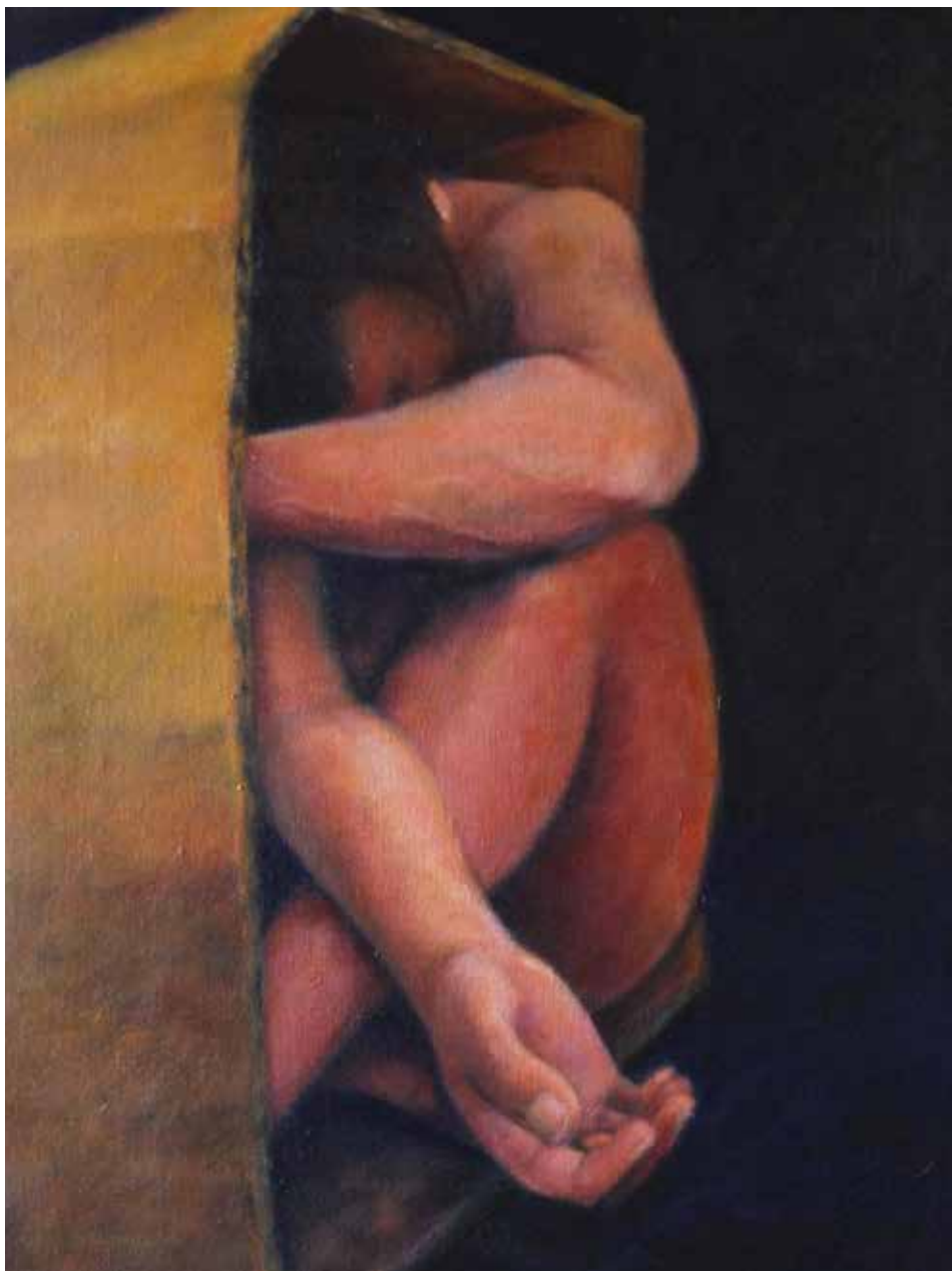
BON NADAL! (Oli sobre tela, 46 x 33 cm)