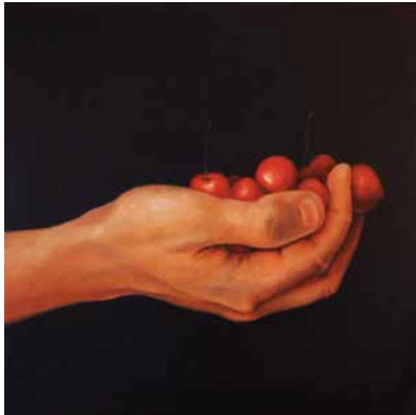
OFRENA COMPARTIDA (Oli sobre tela, 73 x 92 cm) OFRENA: CIRERES (Oli sobre tela, 60 x 60 cm)