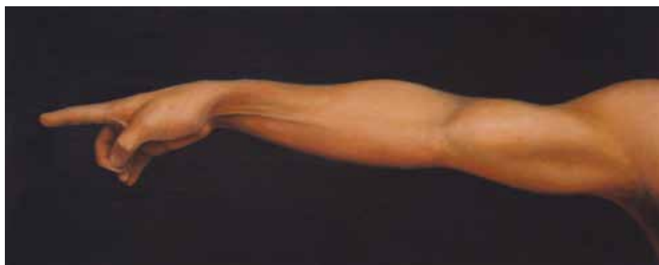
TENTAZIONE (Diptic, Oli sobre tela, 41 x 100 cm c/u)