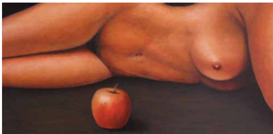
EVA (Oli sobre tela, 46 x 92 cm)