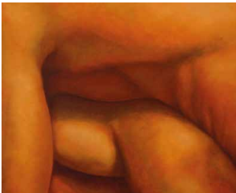
SENDO (Oli sobre tela, 50 x 73 cm) MOLT PROP (Oli sobre tela, 50 x 60 cm)