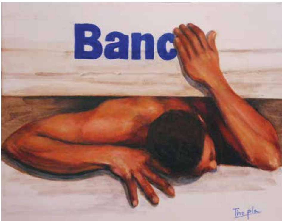
CLAM (Oli sobre taula, 30 x 60 cm)