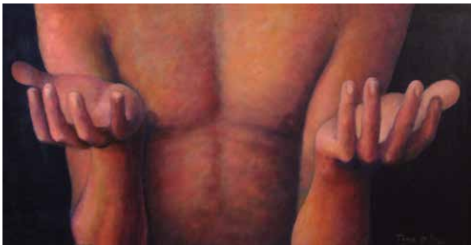
CLAM (Oli sobre taula, 30 x 60 cm)