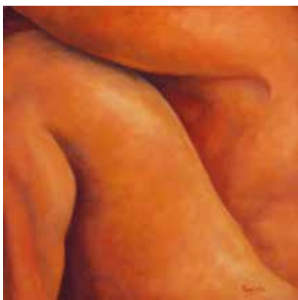
PLECS (Oli sobre tela, 41 x 41 cm) APROPAMENT (Oli sobre tela, 41 x 41 cm) DESCANS (Oli sobre tela, 41 x 41 cm)