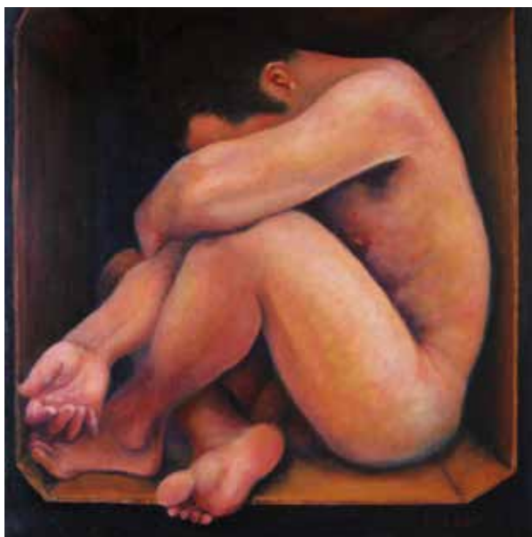
EL MEU PAIS - AHIR (Tríptic, Oli sobre tela, 50 x 50 cm) EL MEU PAIS - HUI (Tríptic, Oli sobre tela, 60 x 60 cm) EL MEU PAIS - DEMÀ (Tríptic, Oli sobre tela, 50 x 50 cm)