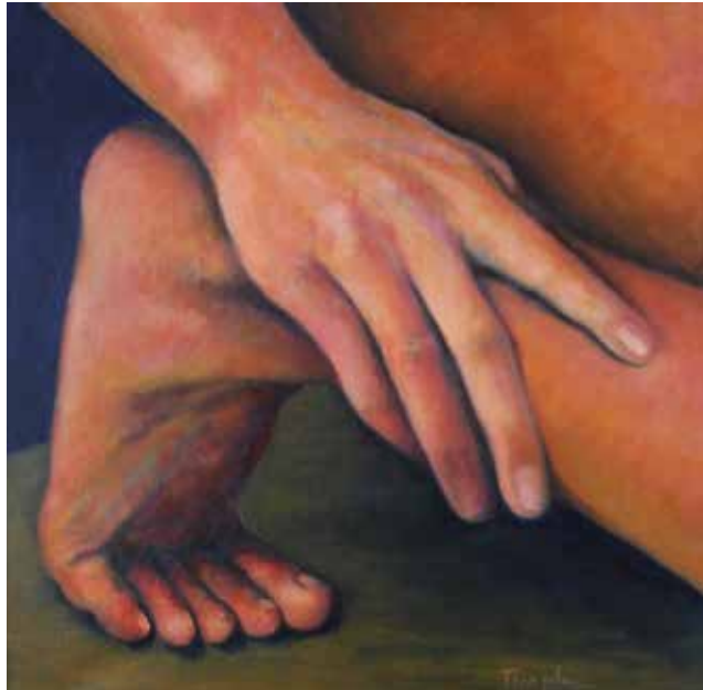
MEDUSA (Oli sobre tela, 50 x 60 cm) AQUILES (Oli sobre tela, 40 x 40 cm)