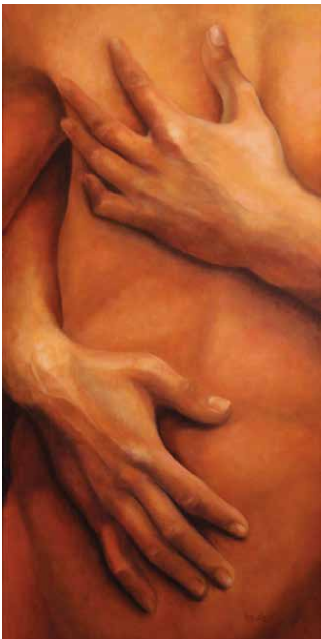
CARÍCIES (Oli sobre tela, 96 x 46 cm)