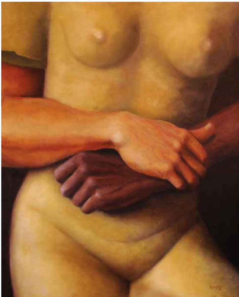
REA (Oli sobre tela, 73 x 60 cm)